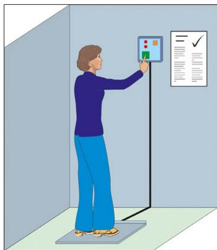
Figura 3. Verificación de la resistencia de puesta a tierra previa entrada a una zona ATEX.

Existen equipos para la verificación de la resistencia de puesta a tierra entre la persona y la suela de su calzado (por lo general, el valor 100 MΩ debe ser el límite máximo aceptable para dicho equipo). Se recomienda hacer estas verificaciones previamente a la entrada de las áreas con riesgo de explosión, de modo que los trabajadores puedan comprobar la resistencia de su calzado antes de entrar en ella. Si los trabajadores deben llevar guantes, su resistencia también se ha de verificar; se llevará a cabo separadamente, para guantes y para calzado. (Ver figura 3).