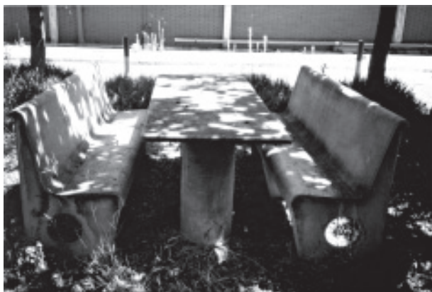
Figura 1. Mobiliario urbano de fibrocemento

El uso de amianto ha sido muy extenso debido a sus propiedades fisicoquímicas, que le proporcionan, entre otras, las siguientes características: gran resistencia al fuego, aislante térmico y acústico, resistencia a los álcalis y ácidos, tixotropante y gran procesabilidad. Por ello, se ha venido utilizando en la construcción, como protección contra el fuego en estructuras metálicas, en paneles acústicos y calorifugados de tuberías, en la fabricación de baldosas y suelos, en placas decorativas de falso techo, como fibrocemento en placas onduladas, planas y tuberías, en pinturas, asfaltos y masillas, etc. Además de este amplio uso en la construcción, el amianto se ha utilizado como aislante en barcos, vagones de trenes, aviones, centrales térmicas y nucleares, en electrodomésticos, en calderas y tuberías y en multitud de aplicaciones. Esta amplitud de uso alcanza al mobiliario urbano, como se puede observar en la figura 1.