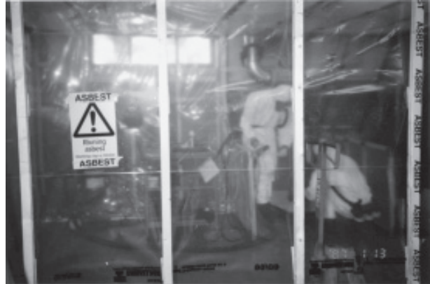
Figura 4. Montaje para obtener el adecuado aislamiento de un trabajo con amianto consistente en la sustitución de una arandela de caucho - amianto de un motor

En la figura 4 se expone un ejemplo de un montaje para obtener el adecuado aislamiento de un trabajo con amianto.