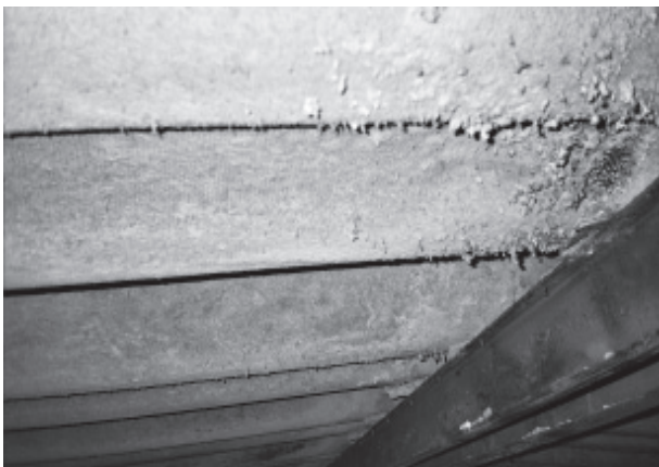
Figura 2. Placas de fibrocemento muy degradadas asimilables a material friable