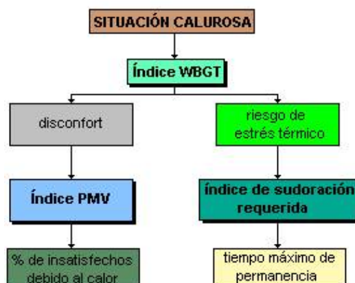
Fig. 1: Índices de valoración de ambiente térmico

Existen diversos métodos para valorar el ambiente térmico en sus diferentes grados de agresividad.