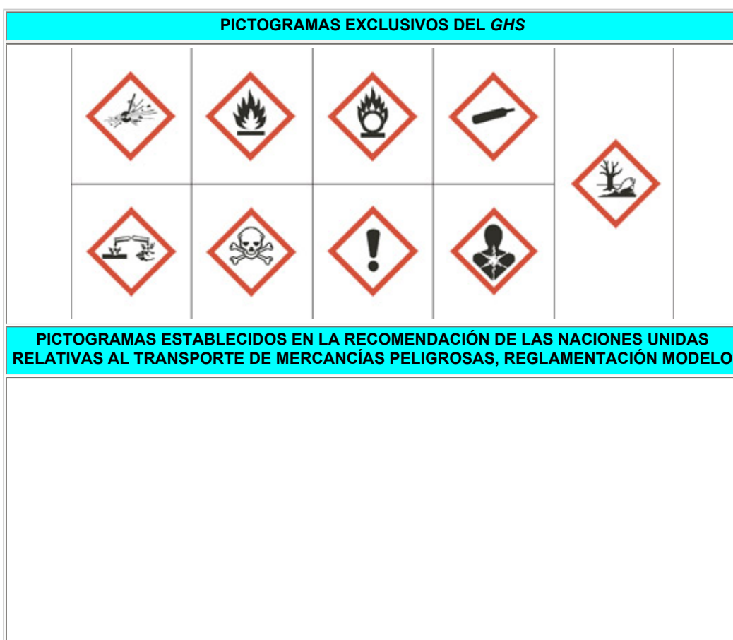
Figura 4 Pictogramas utilizados por el GHS

Parte de los símbolos de peligro que se presentan en la figura 4 fueron tomados de las Recomendaciones de las Naciones Unidas relativas al transporte de mercancías peligrosas.