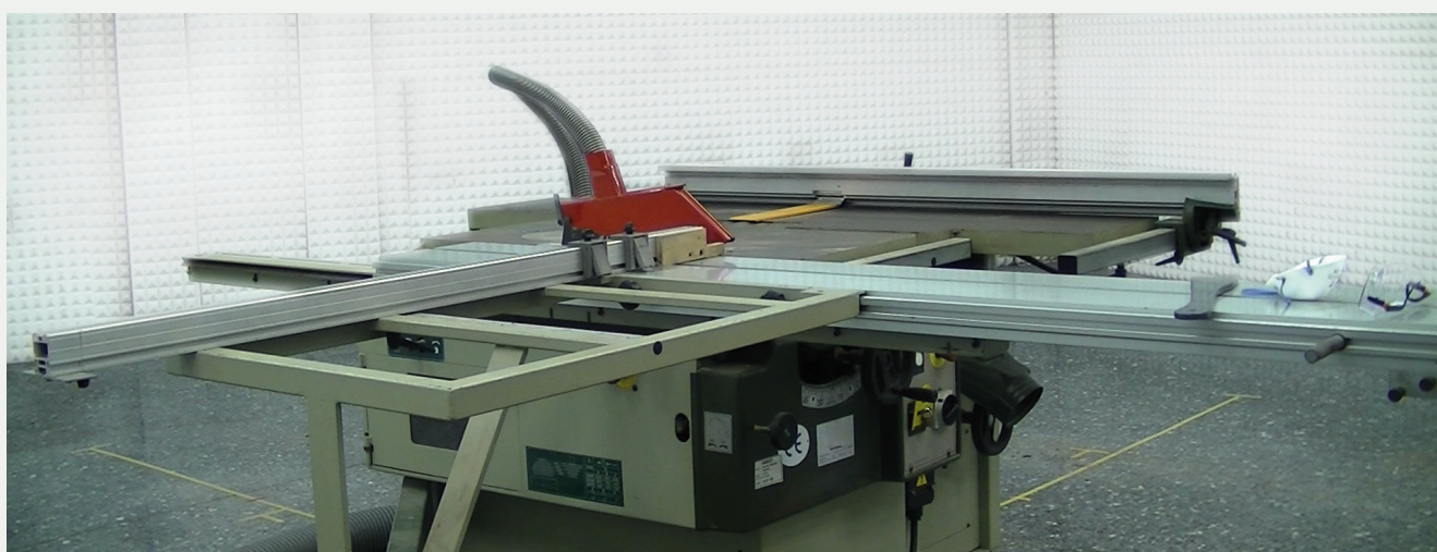
figura 1: máquina combinada. Sierra circular