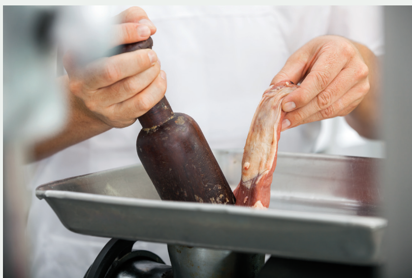
Uso de empujador