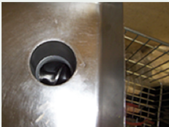
Entrada al husillo