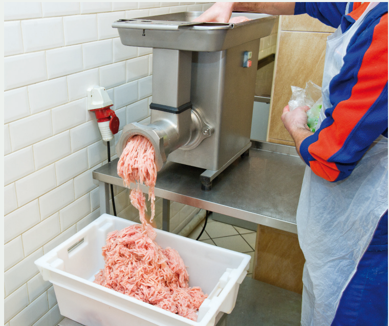
Accediendo con la mano

Acceder con las manos al husillo, debido a unas dimensiones inadecuadas de la entrada de alimentación o a la retirada o inexistencia de placa limitadora (por ejemplo, para empujar los trozos de carne o retirar elementos indeseados, etc).