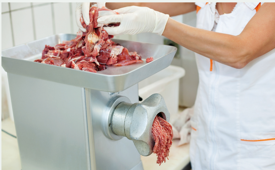
Picado de carne