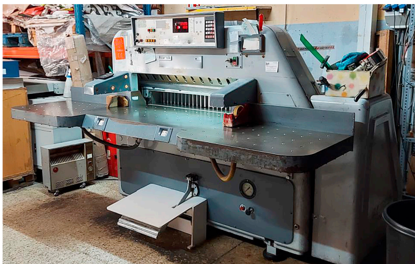
Figura 3: Órgano de accionamiento del pisón (pedal) protegido de forma que se evite su accionamiento involuntario.

El órgano de accionamiento del pisón (pedal) debe estar protegido de forma que se evite su accionamiento involuntario.