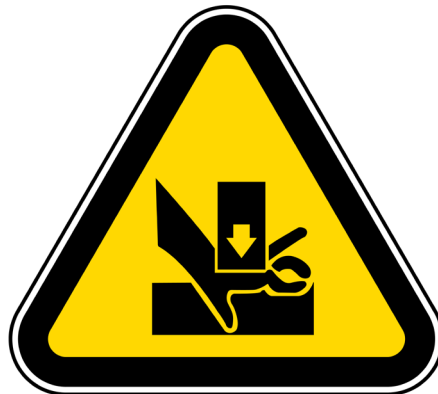
Figura 5: Señal de peligro de atrapamiento/aplastamiento

Respetar los tamaños mínimos de los pliegos de papel permitidos. No utilizar la máquina por más de un operario de forma simultánea. Señalizar el peligro de atrapamiento/aplastamiento.