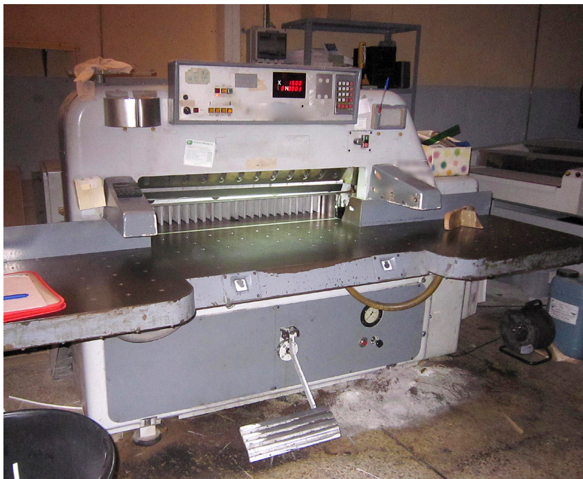
Figura 1: Guillotina corte de papel