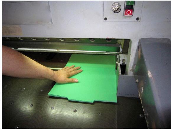
Figura 2: Colocación de la resma con las manos dentro de la zona peligrosa

Colocación de la resma con las manos dentro de la zona peligrosa generada por la trayectoria de descenso del pisón 1 accionado por el pedal.