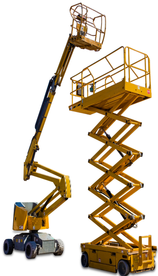
Figura 1: Plataformas elevadoras móviles de personal