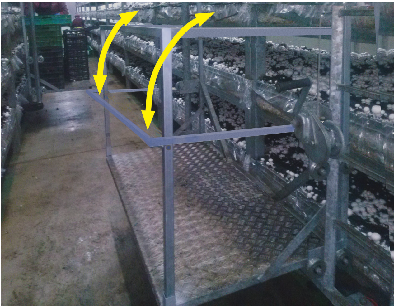
Figura 1: Plataforma para elevación de personas