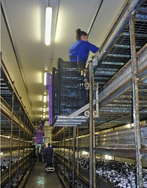
Figura 2: Trabajo en altura sobre plataforma sin protecciones contra caídas

Trabajo en altura realizando tareas de colocación y/o recogida de productos sobre plataforma sin protecciones adecuadas.