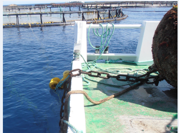
Figura 1: Imagen de una boya sobre la cubierta de la embarcación

Cada plato o muerto tiene su boya correspondiente.