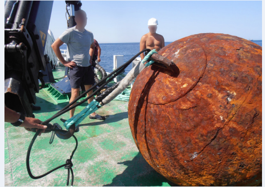
Figuras 2 y 3: Detalles del cabo de retenida y de la zona donde se rompió