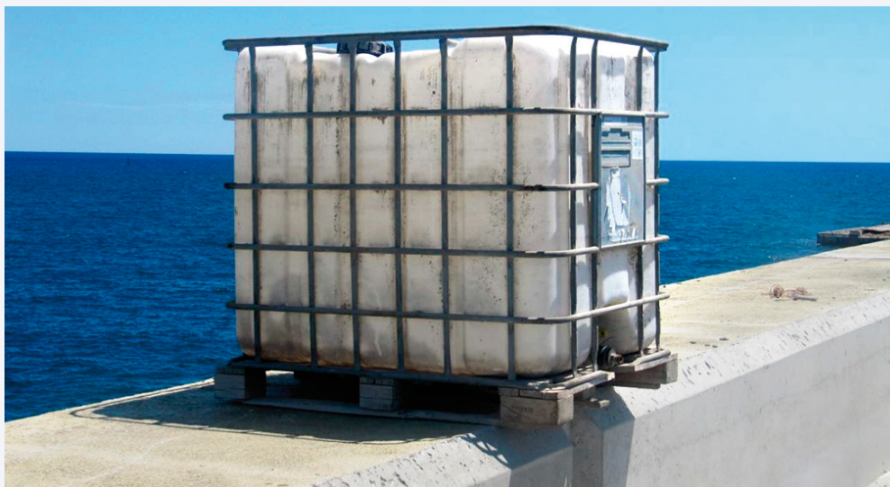
Depósito superior de agua, ubicado en el antepecho de la coronación del espaldón