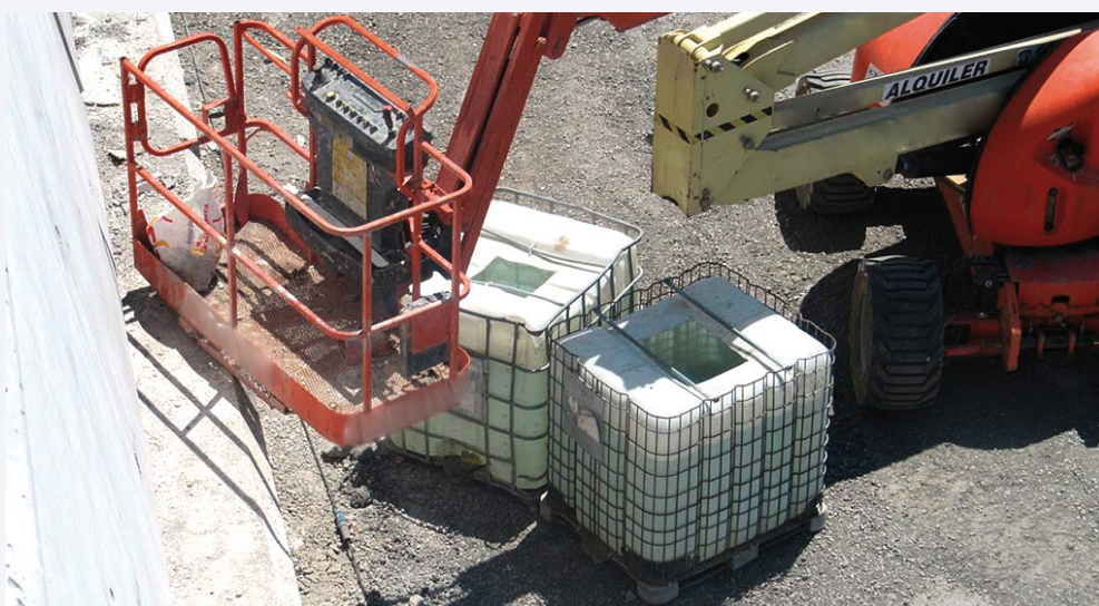
Depósitos inferiores desde los cuales se bombea el agua al depósito superior