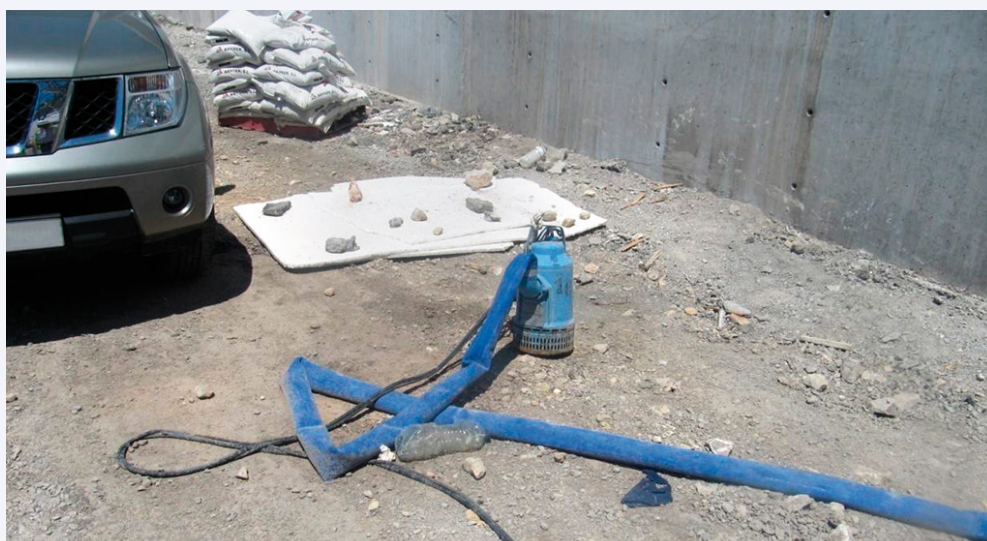
Equipo de bombeo y tubería de impulsión