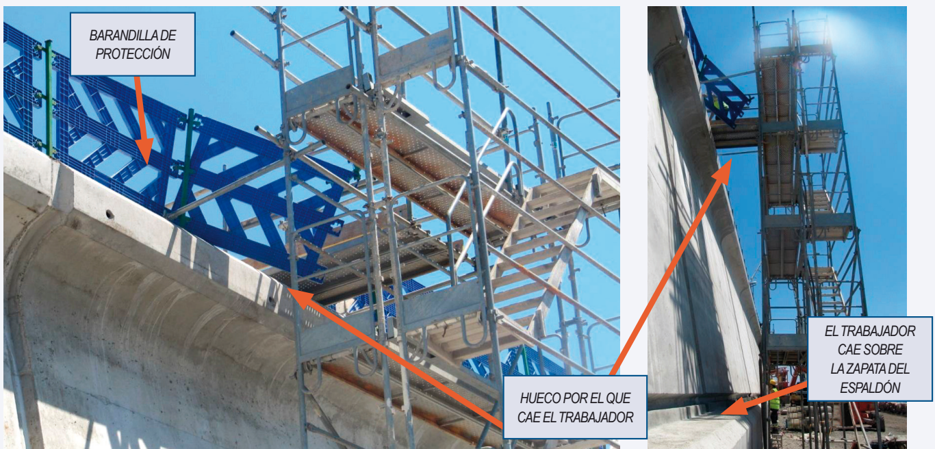
Detalle del tramo de barandilla que cede y hueco por el que cae el trabajador

En las siguientes fotografías puede observarse la situación descrita.