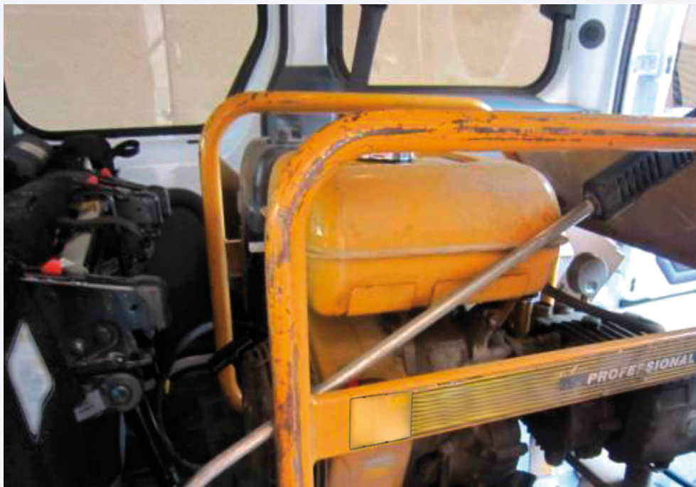
Hidrolimpiadora a motor de gasolina