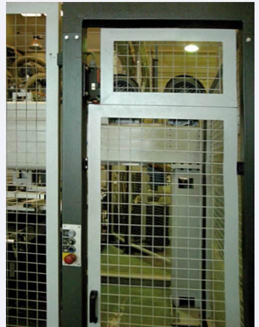
Puerta de acceso en el vallado