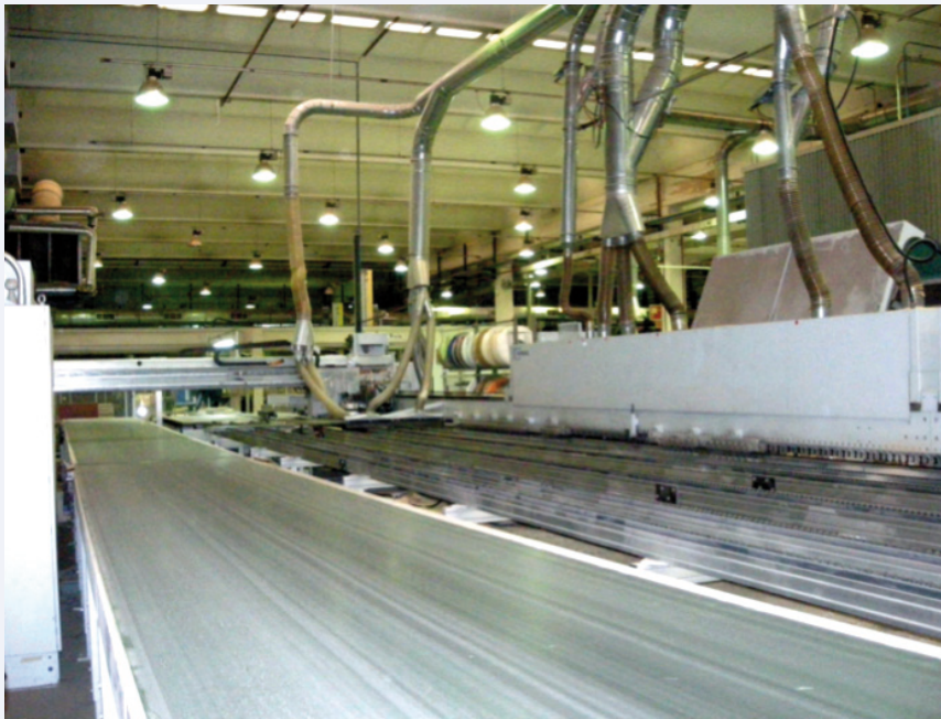
Cinta transportadora en el interior del recinto de la canteadora