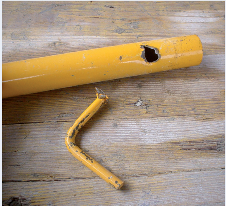
Foto. Vista de detalle de la parte superior del balaustre donde se encontraba soldado el soporte. Nótese, en primer lugar, la notable diferencia de tamaño entre el hueco practicado en el tubo y el diámetro del perfil, lo cual conllevó una relleno importante con material de aporte tras la soldadura. En segundo término también se quiere hacer notar que el soporte no presentaba signos de una utilización intensa

Existe la evidencia de un posible deterioro en las soldaduras de los balaustres. Circunstancia que se podría haber detectado en una revisión programada y periódica.