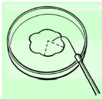
Fig. 1: Preparación en fresco

Este procedimiento es el que utilizan la mayoría de los laboratorios, ya que las muestras se preparan con facilidad y rapidez y además permite identificar muchas de las especies de hongos más habituales. El mayor inconveniente de la observación en fresco es que se puede alterar el ordenamiento característico de las esporas al presionar con el cubreobjetos, por lo que este procedimiento no es válido en los casos en que es necesario conocer la disposición de las esporas.