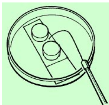
Fig. 3: Cultivo sobre portaobjetos

No deben realizarse cultivos en portaobjetos de hongos de crecimiento lento que pueden ser patógenos dimorfos, como Histoplasma capsulatum , Blastomyces derma titidis , Coccidioides immitis , Paracoccidioides brasiliensis o Sporothrix schenckii .