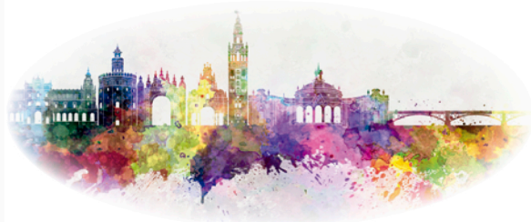
S E V I L L A