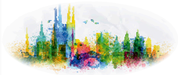
B A R C E L O N A