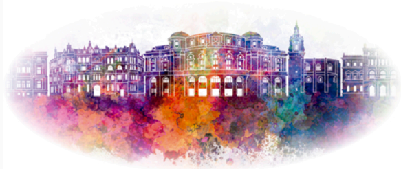
B A R A K A L D O