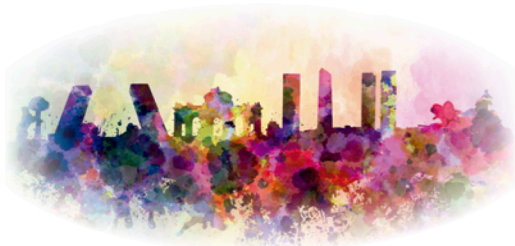
M A D R I D

Una vez aprobado el proceso selectivo, se adjudicarán las plazas que se oferten, según las necesidades de personal.