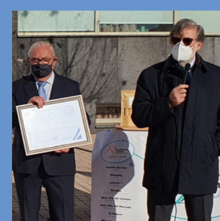
2020 Grupo Latorre