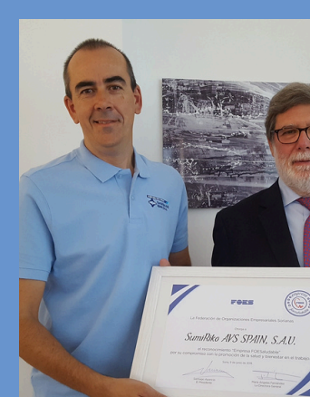
2018 Sumiriko AVS Spain