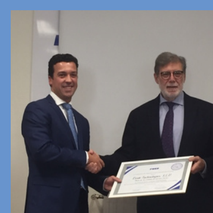
2019 Exide Technologies