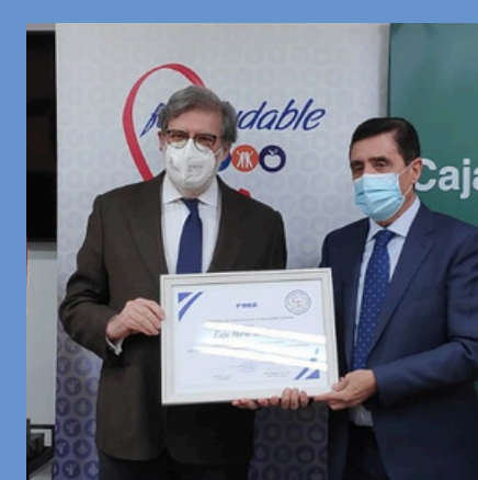
2021 Caja Rural de Soria