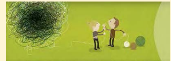
Trabajos saludables: Gestionemos el estrés Campaña «Trabajos saludables» 2014-15

Prácticas para premiar a las empresas y organizaciones que hayan contribuido de forma destacada e innovadora a reducir los riesgos psicosociales y el estrés en el trabajo. La entrega de Galardones se celebrará en abril de 2015. La Guía de la Campaña, de momento sólo en inglés, se puede consultar en este enlace .