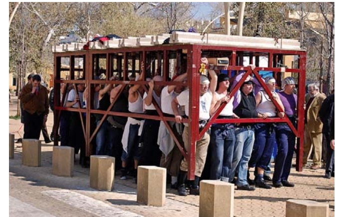
Ensayo de costaleros en la Alameda de Hércules. Sevilla. Marzo. 2010

Dos manuales más sobre el tema son: "Técnicas de movilización de pacientes" , que ofrece el portal: http://www.auxiliar-enfermeria.com/ y: "High-risk Manual handling of patients in healthcare" , publicado por Work Safe BC , en inglés.