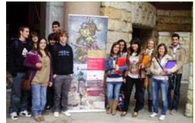
Visita de alumnos a la Exposición: “Trabajo y Salud”, en Gijón

Los lugares que ya ha recorrido la exposición son: Granada, Albacete, Bilbao, León y Gijón.