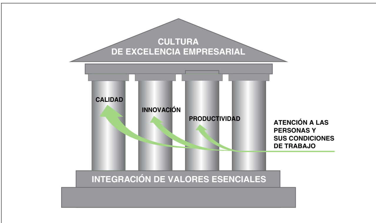
Figura 2. Dinámica del liderazgo transformador de la PRL para la construcción de la excelencia empresarial.

el liderazgo no adquiere su verdadera dimensión si es exclusivo del personal con mando. Los buenos profesionales asumen liderazgo de manera natural en su medio que debiera ser aprovechado y potenciado. Excelentes amigos han llegado alto en sus organizaciones, con notorio poder de influencia, mediante un liderazgo transformador y sin tener prácticamente personas a su cargo al ser responsables de ámbitos estratégicos: innovación y nuevos proyectos, calidad, personal y PRL. En la figura 2 mostramos un esquema de liderazgo propiciador de una cultura organizacional basada en valores para construir la excelencia empresarial, inspirado en otro esquema que diseñamos en la NTP 946 sobre "Valores y condiciones de trabajo".