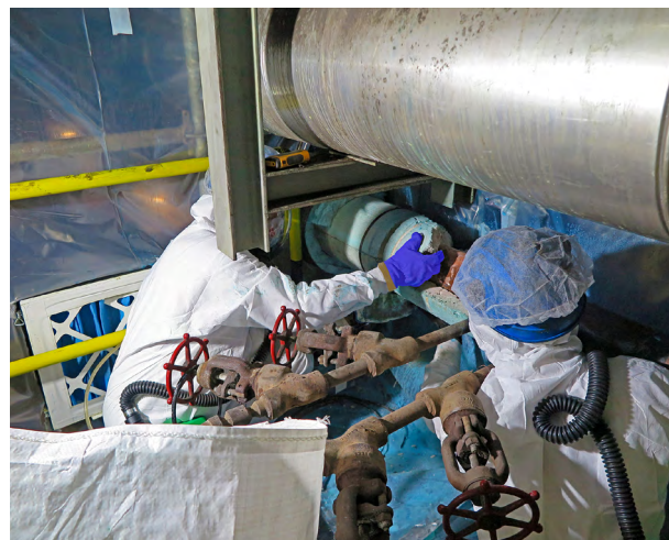
Figura 3. Trabajos de retirada de amianto friable, calorifugado de tubería, utilizando cerramiento con extracción.

SUPUESTO 3: Estrategia de muestreo en operaciones de retirada de calorifugados de amianto (considerado amianto friable). Trabajo de retirada de 2 metros del calorifugado que recubre una tubería de conducción de fluidos calientes mediante cerramiento con extracción (véase fig. 3). La duración prevista de esta tarea es de 100 minutos y la concentración ambiental media, para este tipo de actividad, es del orden de 0,2 fibras/cm 3 .