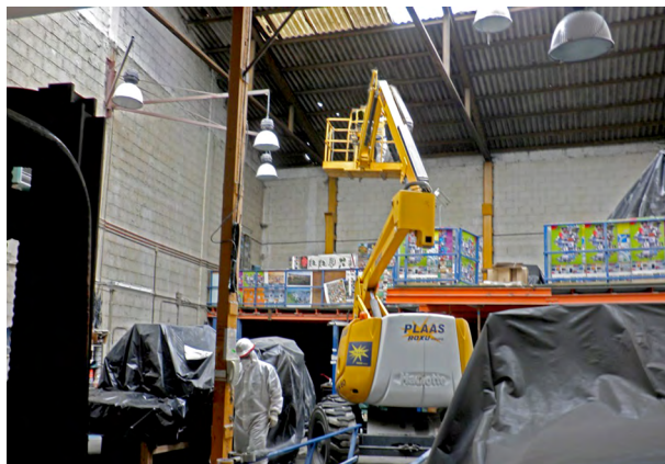
Figura 2. Trabajos de retirada de una cubierta de fibrocemento operando por debajo.

En este caso, como los muestreos tienen que ser personales, y considerando que la mejor estrategia será la que contemple una duración total del muestreo lo más próxima posible a la duración de la jornada laboral, se deberían muestrear las cuatro horas de exposición del trabajador (240 min). La evaluación fiable y representativa de este puesto de trabajo, siguiendo los requisitos del MTA/MA-051 y de la Norma UNE-EN 689, y alcanzar un volumen de aire adecuado para llegar a la zona óptima de recuento, supondría muestrear teóricamente a un caudal comprendido entre 3,2 l/min y 21 l/min, respectivamente. Obviamente, caudales en la zona superior del intervalo no son válidos ya que el método no admite caudales tan altos ( Q \leq 16 l/min),