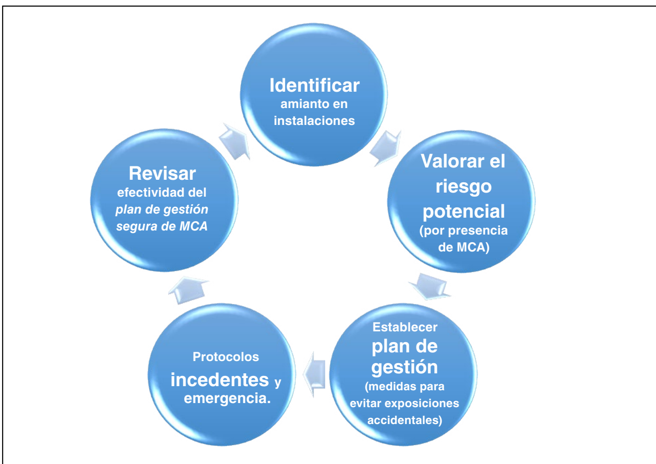
Figura 2. Ciclo de gestión segura de materiales con amianto (MCA) para evitar riesgo por exposición accidental derivado de su presencia

No obstante, en todo tipo de empresas u organizaciones en cuyas instalaciones haya presencia de amianto se puede producir una exposición "accidental", ya sea de su propio personal, o de las empresas que contrate, en determinadas situaciones y variedad de actividades. En este sentido, conviene recordar que el Real Decreto 374/2001, de 6 de abril, sobre la protección de la salud y seguridad de los trabajadores contra los riesgos relacionados con los agentes químicos durante el trabajo, establece medidas para identificar, valorar, localizar, señalar y controlar adecuadamente el riesgo derivado de la exposición por presencia de MCA (o PMCA ) al considerar que existe "exposición" a un agente químico, cuando dicho agente esté presente en el lugar de trabajo y se produce contacto de éste con el trabajador (en este caso por vía inhalatoria). En la figura 2 se muestra el proceso cíclico para la gestión segura de MCA para evitar estas exposiciones.