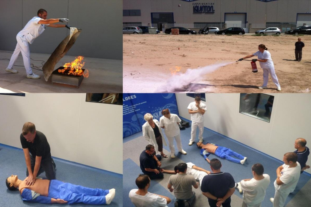
Formación Prevención de Riesgos Laborales