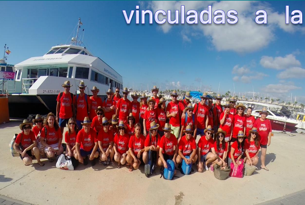
vinculadas a la actividad física