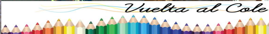
Vuelta al Cole