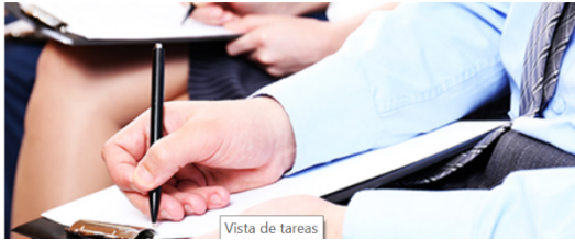
Vista de tareas

La presentación de quejas y/o sugerencias por parte de todos aquellos usuarios de los servicios que presta el Instituto es un mecanismo esencial para mejorarlos, por lo que les pedimos su colaboración para introducir los cambios que den respuesta a sus demandas. Los sistemas de quejas y sugerencias se regulan en el Real Decreto 951/2005, de 29 de julio, por el que se establece el Marco general para la Mejora de la Calidad de los Servicios en la Administración General del Estado.