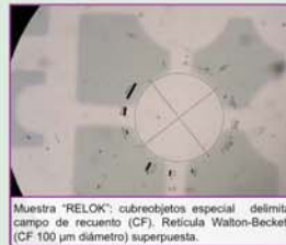
Muestra "RELOK", cubreobjetos especial delimita campo de recuento (CF). Reticula Walton-Beckett (CF: 100 µm diámetro) superpuesta.

La falta de un mecanismo que posibilite re-examinar mismos campos de recuento (CF), seleccionados aleatoriamente (20-100 CF entre 45.000 posibles), dificulta la estimación de sesgo y precisión intra- e inter-analista (5) sin interferencia de VP (caracterizada y sobre la que no puede actuar).