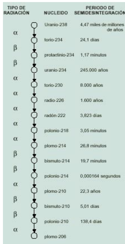
Fig. 2: Desintegración radiactiva del Uranio-238