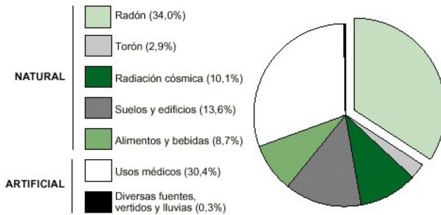
Fig. 1: Contribución de las distintas fuentes de exposición, de origen natural y artificial, a la dosis recibida por la población.

Durante mucho tiempo existió la opinión de que la radiación natural no tenía un efecto significativo desde el punto de vista de daños para la salud del público en general, pero esta idea cambió totalmente cuando en los años 70 y 80 se evidenció que en el interior de algunas casas y en distintos países el nivel de radón existente significaba concentraciones de varias decenas e incluso miles de Bq/m 3 , lo que indicaba que las dosis recibidas por sus ocupantes eran de algunas decenas de mSv al año. El principal causante de esta situación es el radón, que es el único elemento gaseoso de las cadenas de desintegración radiactivas, por lo que se desplaza con facilidad a partir del punto en que se genera y entra en los edificios.