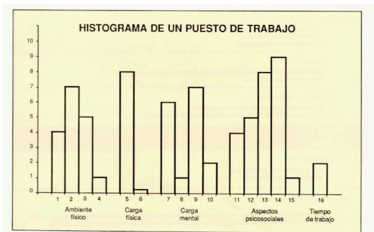
Fig. 1: Histograma de un puesto de trabajo

Mediante las tablas de valoración que aporta el método, todos los parámetros reseñados quedan cuantificados de acuerdo con las puntuaciones establecidas, las cuales son susceptibles de ser plasmadas en unos diagramas de barras o histogramas. (ver Fig. 1)