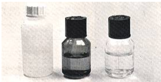
Fig. 5: Frascos para el transporte de muestras y de soluciones absorbentes

Como precaución general las muestras, en cuanto no se analicen, se guardarán en nevera y al abrigo de la luz.