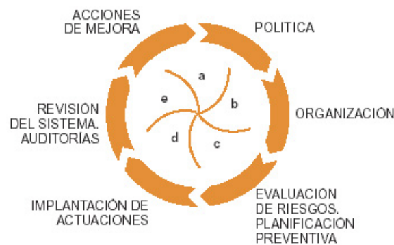
Figura 1 Elementos del Plan preventivo en un proceso de mejora continua

Respecto a la organización preventiva específica, son figuras clave, además de la del Delegado de Prevención y del Comité de Seguridad y Salud, cuando sea requerido, la del trabajador designado, si ésta es la modalidad de organización elegida o la del "coordinador de prevención", como se podría denominar, si la modalidad elegida es la de Servicio de Prevención Ajeno. En todo caso, se quiere destacar la importancia de quien a tiempo, normalmente compartido con su actividad laboral, ejerza funciones preventivas de promoción, coordinación y apoyo en este campo. Persona, que además de disponer como mínimo de una formación básica en prevención debería reunir una serie de condicionantes personales: competencia profesional con habilidades directivas, liderazgo, tiempo hábil para la acción preventiva, voluntariedad en la función y sensibilidad social.