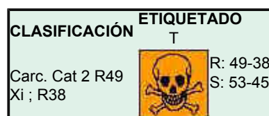
Figura 4 Clasificación y etiquetado de las lanas minerales