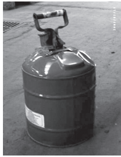
Envase de seguridad