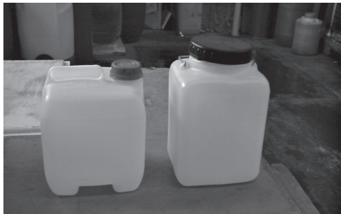
Envases de 10 litros