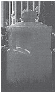
Envase de 25 litros