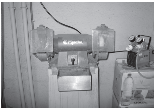
Figura 2. Muela de afilado

de nuevo para su recuperación. El afilado se realiza mediante muelas (esmoladeras), cuyas características varían según las instalaciones. En general, las más utilizadas son las que llevan una protección para evitar la proyección de las virutas y disponen de un recipiente con agua para enfriar el electrodo (ver fig. 2). El polvo generado en el afilado se deposita normalmente sobre la muela y en sus proximidades. Para evitarlo algunas muelas disponen de un sistema de aspiración localizada de aire, existiendo en el mercado máquinas de afilado, que funcionan en sistema cerrado, quedando el polvo generado almacenado en su interior.