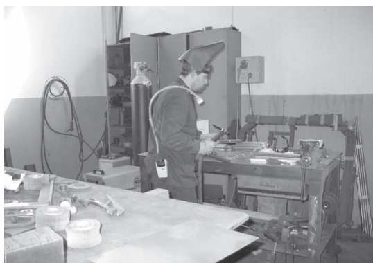
Toma de muestras con filtro