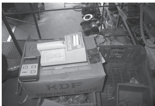
Mediadas de tasa de beta+gama y alfa