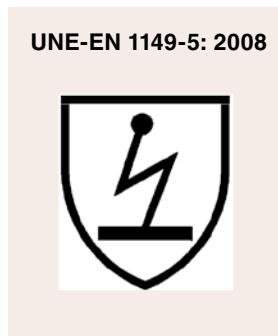
Figura 2. Pictograma

El marcado de la ropa, en lo relativo a las propiedades "antiestáticas" específicas, deberá incluir el pictograma de protección contra la electricidad estática (figura 2), junto con la referencia a la norma específica.