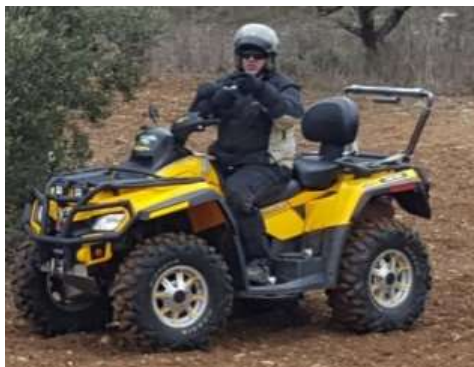
AR QUAD Marcado CE