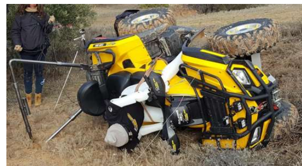
AR QUAD TOPS