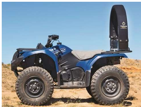
LIFEGUARD Marcado CE