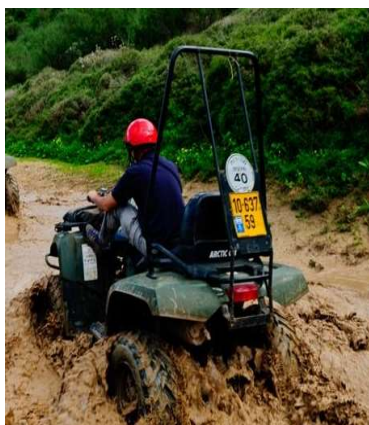
SAFETY ARCH ROPS