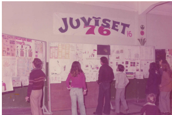
Exposición de dibujos Juvyset 1976

febrero de 2010, se trasladan las oficinas a la Avda. Juan Carlos I Rey, nº 2, en la que continúa actualmente siendo visible la identidad corporativa del INSST en la principal avenida de la ciudad. La oficina está alojada en uno de los edificios modernistas más emblemá-