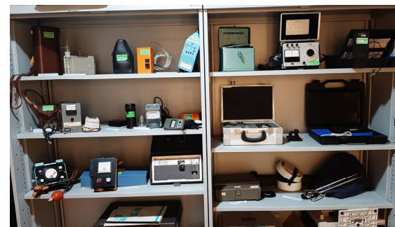
Antiguos aparatos de medición expuestos en el Gabinete