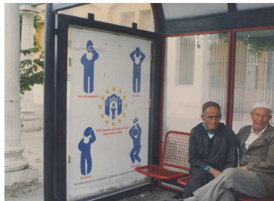
Difusión en la vía pública Día Europeo de la Seguridad en el Lugar de Trabajo. Año 1992