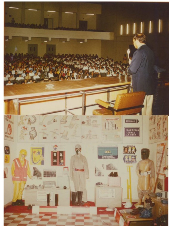
Actividades año 1974: jornadas y exposición.

febrero de 2010, se trasladan las oficinas a la Avda. Juan Carlos I Rey, nº 2, en la que continúa actualmente siendo visible la identidad corporativa del INSST en la principal avenida de la ciudad. La oficina está alojada en uno de los edificios modernistas más emblemá-