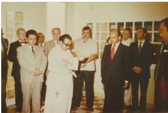
Inauguración local en C/ Roberto Cano, año 1974

Recorte de prensa de la época anunciando la creación del Consejo