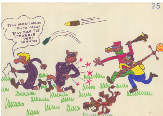
Dibujo del concurso. Año 1974.

En el año 1974 el Gabinete organizó en la ciudad la "Campaña Nacional de Sensibilización", con un presupuesto de 60.000 pesetas que contó con numerosos actos y actividades, incluyendo un concurso de dibujos infantiles entre escolares de la antigua EGB, que aún conservamos en el Gabinete, y que al ganador se le premió con la cantidad de 5.000 pesetas, lo cual para la época era una cantidad nada despreciable para un niño. Fue tanta la difusión que el Día