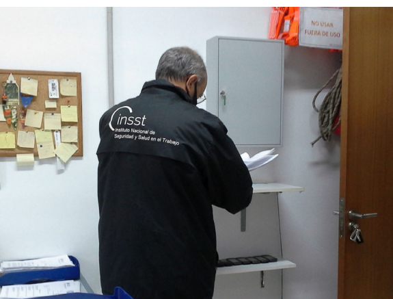
Visita a empresa de servicios.

Las actividades técnicas que actualmente realiza pueden ser a requerimiento normativo (investigación de