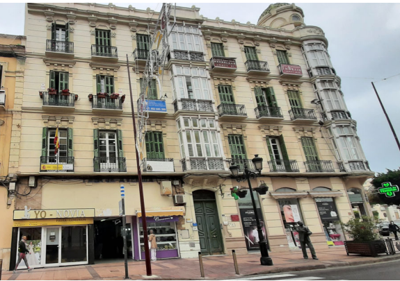
Edificio Metropol. El Gabinete ocupa una oficina en la 1ª planta.

ticos de la ciudad, “Edificio Metropol”, con proyecto del arquitecto de Manuel Medina de 1910 y rehabilitado en 2006. Se aprovecha el traslado para la renovación total del mobiliario, que había quedado obsoleto. Cuenta con biblioteca con todo el material divulgativo del INSST que sirven de apoyo al trabajo de los técnicos, así como a personas relacionadas con el mundo laboral y que han solicitado su consulta. Material que en numerosas ocasiones se ha repartido a centros y organismos oficiales, empresas y centrales sindicales.