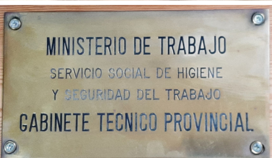
Primeras placas del Gabinete