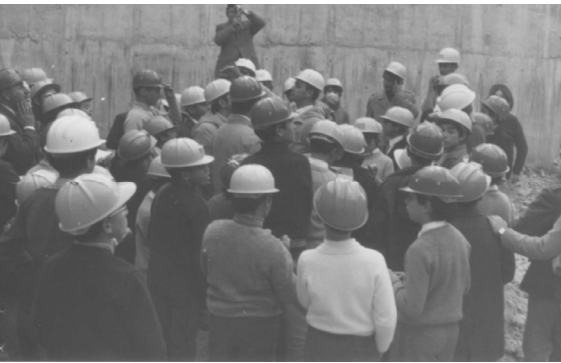
Visita de alumnos de COU a la obra del Parador Nacional de Turismo. Año 1972

accidentes, campañas sectoriales de seguimiento, divulgación de material, formación de trabajadores, campañas de sensibilización, secretaría de la Comisión Provincial y resto de funciones encomendadas por la dirección del Instituto.