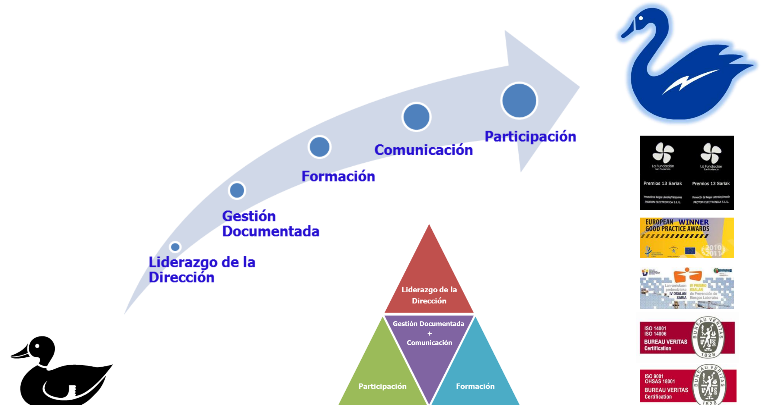
DE PATITO FEO A CISNE 2008-2013 EVOLUCIÓN PARA MICRO PYMES EN SEGURIDAD Y SALUD LABORAL

Cómo queremos hacer nuestro Trabajo (Aptitud + Actitud): Seguros + Eficaces + Eficientes = Con Sentido Común.