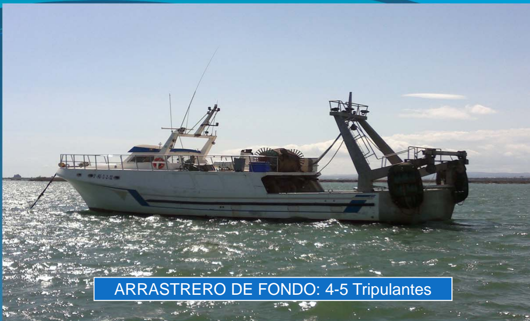
ARRASTRERO DE FONDO: 4-5 Tripulantes