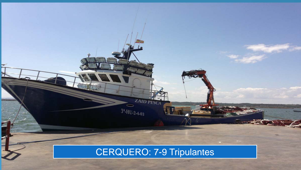
CERQUERO: 7-9 Tripulantes