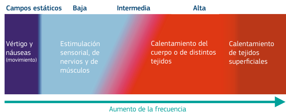
Figura 2.1. Efecto de los campos electromagnéticos en diferentes intervalos de frecuencias (los intervalos no están representados a escala)

Estos conceptos se ilustran en la figura 2.1.