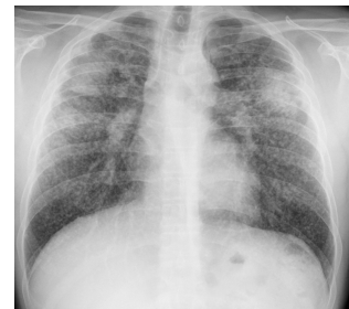
Silicosis complicada con masas de FMP en ambos campos superiores