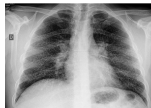
Silicosis simple. Opacidades Nodulares plq 3/2 (clasificación ILO)

En algunos casos de presentación atípica, es necesario obtener una muestra de tejido mediante broncoscopia o video-toroscopia para excluir otras causas.